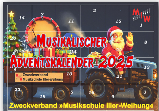
Musikalischer Adventskalender 2025

auf der Homepage der Musikschule Iller-Weihung. Schülerinnen, Schüler und Lehrkräfte halten täglich vom 01. bis zum 24. Dezember hinter jeder Tür eine musikalische Überraschung bereit und begleiten durch die Adventszeit.