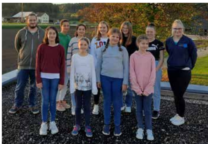
Unsere Jungmusiker zusammen mit ihren Jugendleitern

Der Abend wurde dann abgerundet mit dem gemeinsamen Pizzenessen und die Kinder einigten sich auf den Film „Zoomania“.