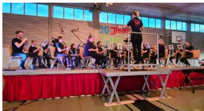
Juka Balzheim-Dietenheim-Regglisweiler-Wain beim 30-jährigen Jubiläum Juka AHS

Unsere gemeinsame Jugendkapelle Balzheim-Dietenheim-Regglisweiler-Wain hatte am 16. Oktober einen Gastauftritt bei dem Jubiläumskonzert der Jugendkapelle Altheim-Hüttisheim-Schnürpflingen.