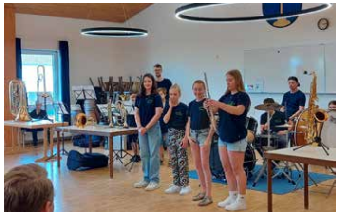
Instrumentenvorstellung durch die Jungmusiker