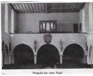
Prospekt der alten Orgel