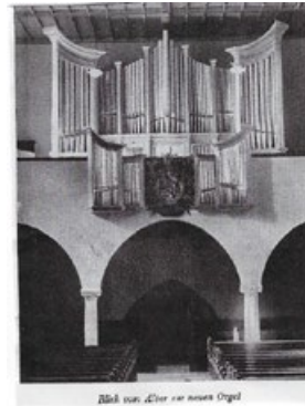
Wörter: „Die neue Orgel“

Wurmbefall und Verschmutzung des Gehäuses und der Pfeifen festgestellt wurden, begann man über eine Generalüberholung nachzudenken, um die Orgel wieder für viele Jahre auf den neuesten Stand zu