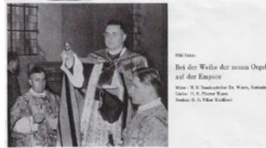
Wörter: Bei der Weihe der neuen Orgel auf der Kapelle Wörter: H. H. Neukirchner Dr. Wain, Kandelberg Lektor: H. H. Pflanzl Wain Drucker: H. H. Pflanzl Wain