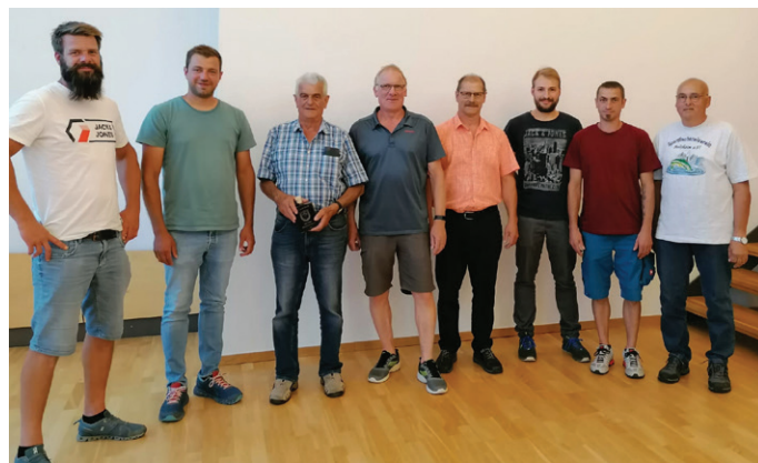
Jubilare und gewählte Vorstände