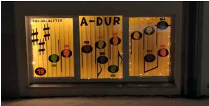
Adventsfenster der A-Dur in Regglisweiler

Nach dem letzten Auftritt in Regglisweiler ließen wir das Jahr bei einer kleinen Feier mit Punsch und Wienern ausklingen. Im neuen Jahr geht es dann ausgeruht und motiviert in die Proben für den Auftritt am Muttertags-Essen des Musikverein Balzheim.