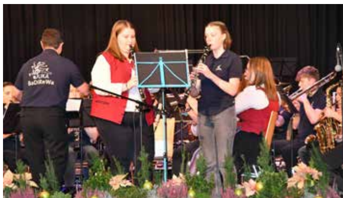
Die Juka BaDiReWa beim Jahreskonzert in Dietenheim