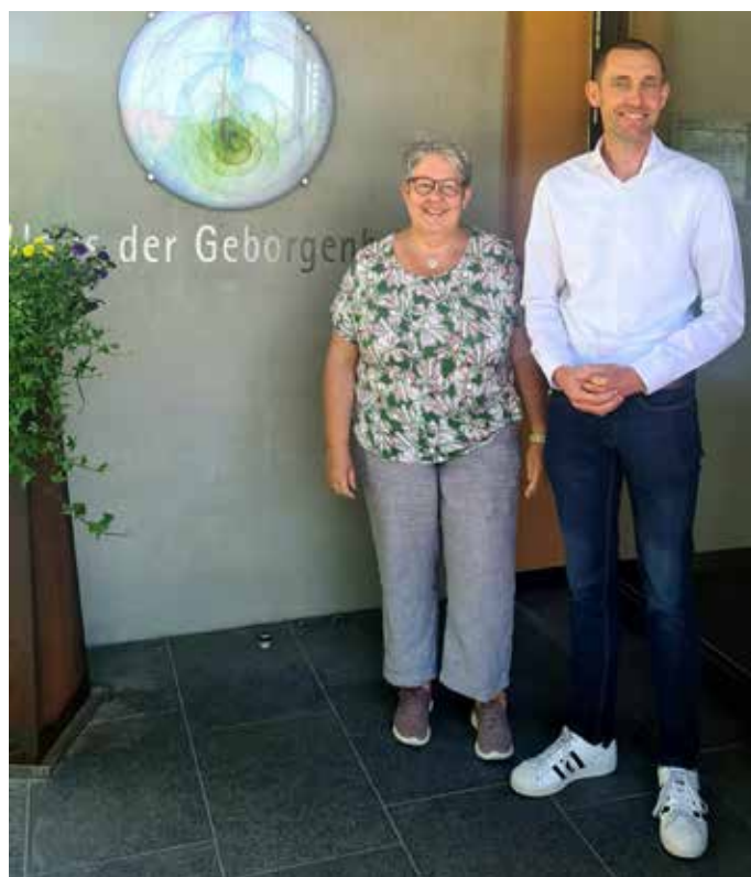
Foto: Sonja Remiger (Hospizleitung Benild-Hospiz) / Sebastian Lautenfeld (Geschäftsführer Benild-Hospiz)