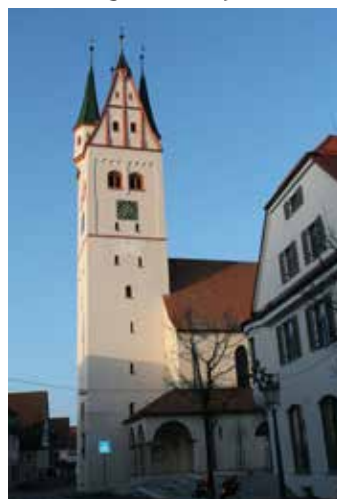
Ihr KGR St. Martinus Dietenheim

Der KGR der Kirchengemeinde St. Martinus Dietenheim, lädt alle Gottesdienstbesucherinnen und Gottesdienstbesucher am Samstag, 03. Dezember nach der Vorabendmesse zu einem Gespräch unter dem Kirchturm ein.