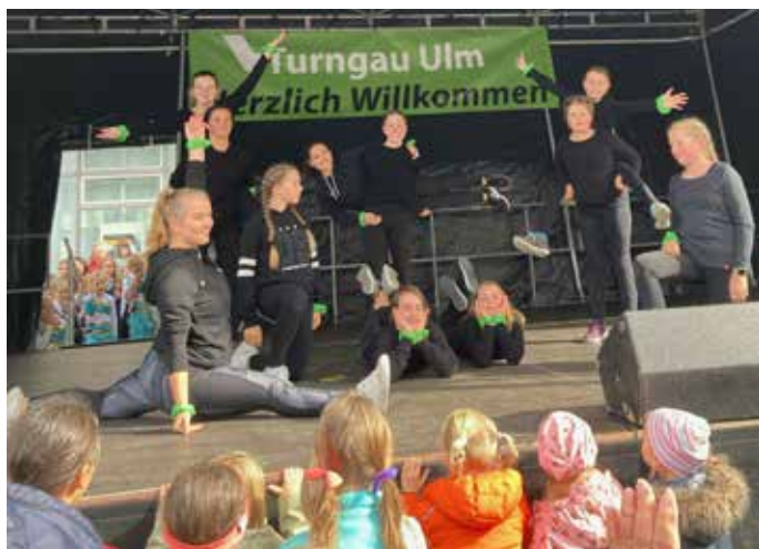
Auftritt der Dancing Queens in Ulm

Die "Dancing Queens" des SVB Gymnastikabteilung hatten am 09. Oktober 2022 ihren ersten Auftritt auf auswärtiger Bühne. Am Sonntag Nachmittag durften die Mädels ihre Choreografie auf dem Münsterplatz in Ulm auf der Bühne der Turngau Ulm e.V. zeigen.