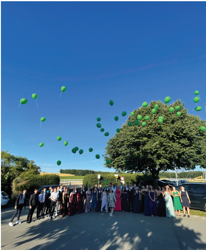
Am GO gehört es zur Tradition, dass die Abiturienten zum Abschied Luftballons mit guten Wünschen steigen lassen.