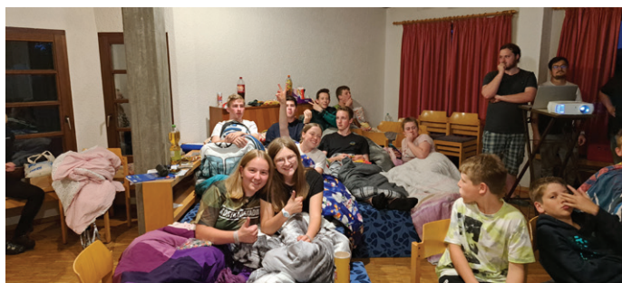
Letzter Abend: Kino