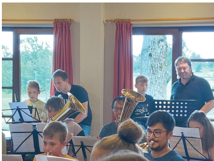
Probe in der Juka-Freizeit