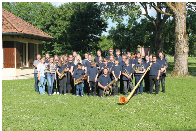
Alle Jungmusiker mit Ausbilder und Küchenteam

Am Samstag hieß es dann leider schon wieder Abschied nehmen von unserem liebgewonnenen Heim in Asch. Alle packten nochmal an und nach einer Menge Wischen, Saugen und Räumen brachen wir schließlich gegen Mittag wieder Richtung Balzheim, Dietenheim, Regglisweiler und Wain auf. Mit im Gepäck: Die Vorfreude auf die Freizeit 2023.