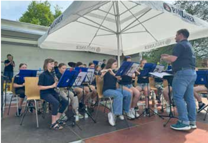
Vororchester A-Dur BaDiReWa

Neben Liedern wie Pippi Langstrumpf oder der Europahymne spielten die Kids auch schon ihre ersten Polkas und gaben zur Zugabe Lieder wie "Von Freund zu Freund" und "Ein Leben Lang" von den Fäaschtbänkern zum Besten.