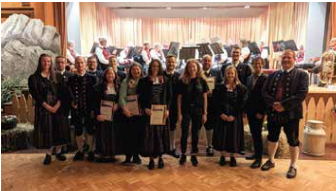
Die geehrten Musiker