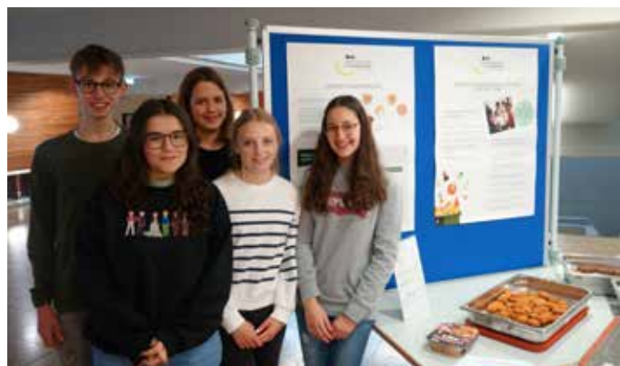
Schülerinnen und Schüler des GO präsentierten Gesundes und Wissenswertes rund ums Essen.

von Mensakoordinationsstelle, BeKi-Referenten, Mensamitarbeiterinnen und Schülern gibt es jedes Jahr viel Leckeres, das nicht nur satt macht, sondern auch das Bewusstsein für gesunde und nachhaltige Ernährung schärft.“