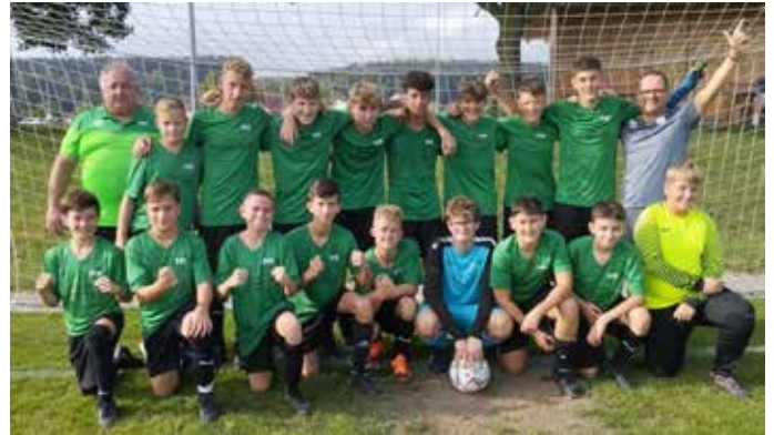
Der dritte Spieltag der C-Jugend gegen den FV Weißenhorn endete mit einem 5:3 Sieg.

die SGM mit zwei weiteren Toren den Vorsprung auf 5:1 ausbauen. Der FV Weißenhorn schaffte es noch mit zwei Treffern auf 5:3 heranzukommen. Jedoch war unserer Spielgemeinschaft der wohlverdiente Sieg nicht mehr zu nehmen. Die C-Jugend der SGM Altenstadt / Balzheim steht somit derzeit in der Tabelle auf dem zweiten Platz, einen Punkt hinter der führenden Mannschaft des SV Pfaffenhofen. Gratulation Jungs, weiter so!!